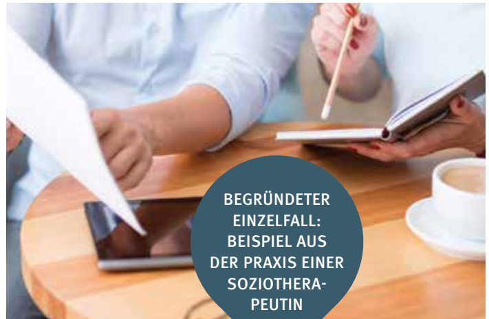
Formular 27 Betreuungsplan

BEGRÜNDETER EINZELFALL: BEISPIEL AUS DER PRAXIS EINER SOZIO THERA- PEUTIN